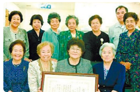
最優秀の農林水産大臣賞を受けて喜ぶ座喜味環境を守る婦人会のメンバーら＝2004年

朝市を始めたきっかけについては「当たり前のように作っていた土地の食べ物の作り方をかなり忘れていた。『作る』から『買う』に変わった現実を思い知らされている」とし、「作り続けないと作れなくなる。地域の食べ物は、作り方を含めて伝え続けたい」と説明した。朝市はコロナ禍によって閉鎖を余儀なくされたが、20（令和2）年の2月まで約14年にわたって続けられ、人気を集めた。（山城紀子）