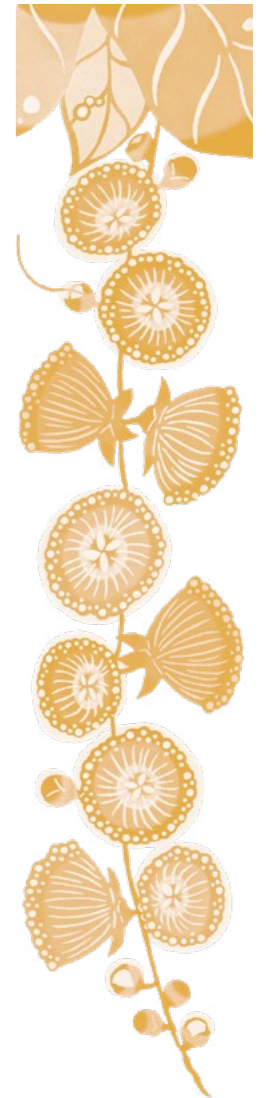
参考文献 「社会を拓いた女たち」(高里鈴代、山城紀子、2014年、沖縄タイムス社)

「ところで、わたしはなぜここに?」と自分のことを振り返ってみる。変わりゆくのは周囲だけではなく、あなた自身も同様だ。どこを、いつ、どんなファッションで、どんな目的で訪ねるのか。そこにどんな人が居る前提で、どのように振る舞う前提でいるのか。あなたの「居場所」はどこで、どこにないのだろう。