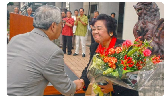
沖縄市長に初当選し、初登庁で職員らに迎えられる東門美津子。県内初の女性首長となった=2006年5月12日