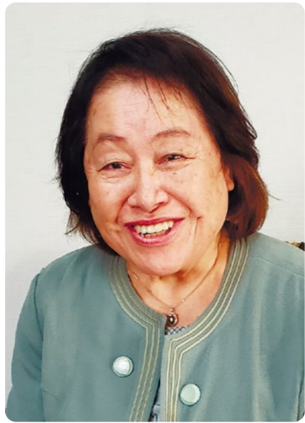
(2021年5月撮影)