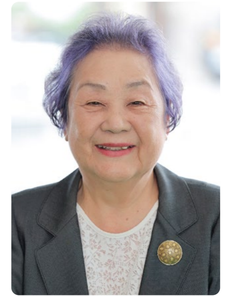
(2022年10月撮影、琉球新報社提供)

約20年にわたり政治・行政の道を切り拓いてきた美津子は「女性たちに助けられてきた」と言い切る。「女性だからこそ分かることがある。政策決定の場に女性の登用が必要だ。女性は決してあきらめずに声を上げ、行動することが大切だ」と話し、女性副知事が居続けることを願った。（岩崎みどり）