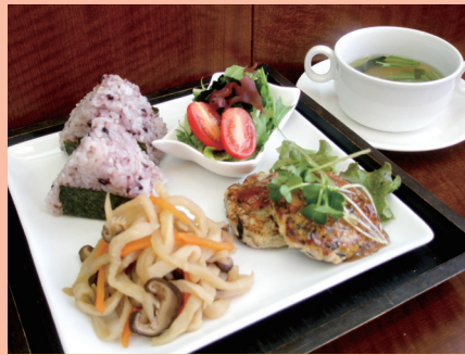
糖尿病のバランス食

当院の管理栄養士による料理教室を毎月2回開催し、2026年4月で447回を迎えます。2か月ごとにテーマを変え(例:腎臓にやさしい食事)、テーマに合った食材と献立の立て方、1食分の量や成分の割合、調理器具の選び方など、30分程度、目の前での調理を見ながらの説明の後、皆で試食する気軽な教室です。定員15名の事前予約制で、患者様や地域の方々が参加しています。