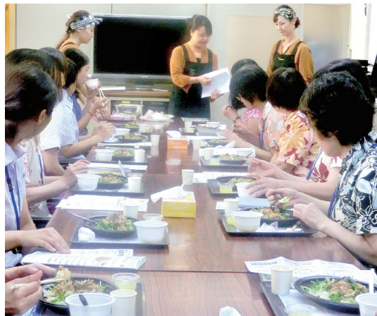
企業内でのランチョンセミナー

料理教室のノウハウを活かし、産業保健(産業医)契約企業で昼休みを活用した支援を行っています。働き盛り世代の課題である肥満や脂質過多をテーマに、食事の量やバランスを中心とした内容です。“もっと気軽に!”のアイデアとして、持参した弁当の写真を撮り、スクリーンに投影。食べながら、誰のものか伏せた状態で弁当に管理栄養士がバランスや量について足し算引き算のコメントをしていきます。準備不要で参加者分のお昼ご飯のコメントが聞けると大変好評です。