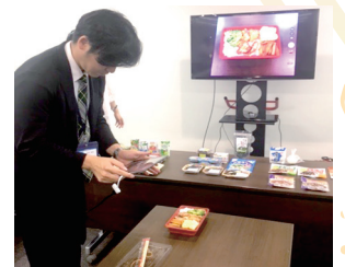
弁当の写真を撮る職員