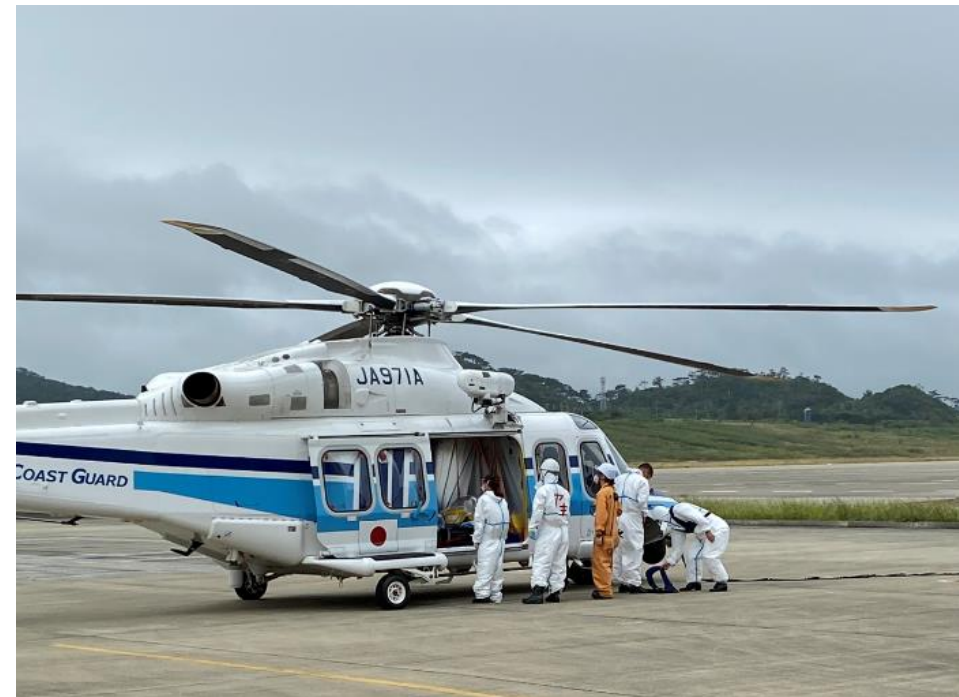
患者さんのお迎えのため、 石垣島よりさらに 南の与那国島までヘリで向かう