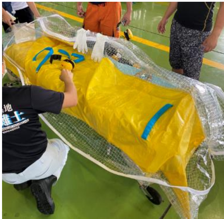
患者を収容するための トランスバック