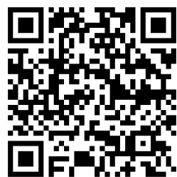
平和・地域外交推進課HP