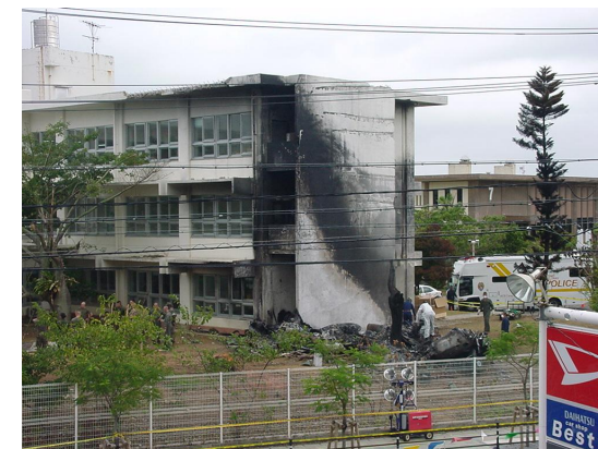
2004年にCH-53ヘリが墜落した沖縄国際大学