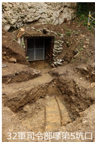
32軍司令部壕第5坑口