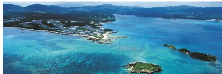
辺野古新基地建設予定地（着工前）