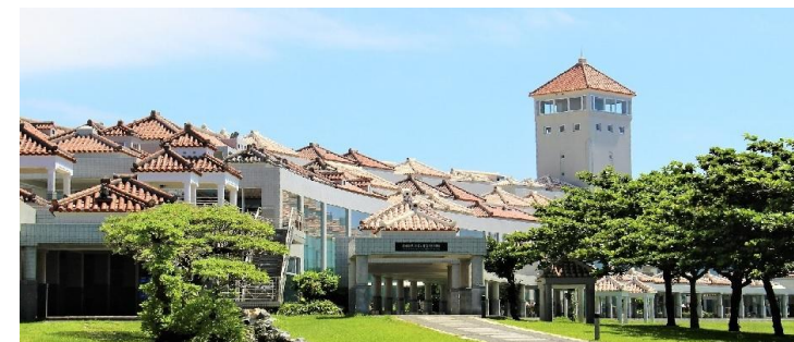
沖縄県平和祈念資料館