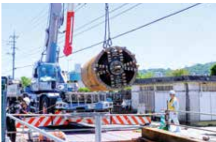
道路を掘り起こすことなく 水道管を設置するための掘進機械