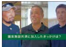
【動画】園芸施設共済制度(沖縄県内農家のインタビュー編)