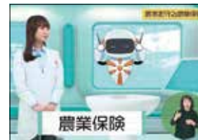
【動画】農家を守る農業保険(うまちゅひろばR7.6)