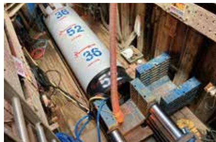
地下での水道管の掘進作業状況 (ジャッキによる推進工事)