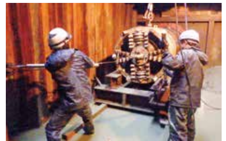
終点に到達した掘進機械 (水道管の設置完了)