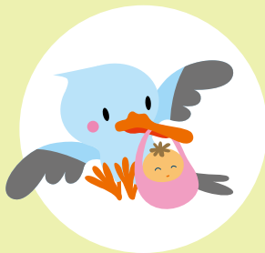
ゆがふしまづくり計画 キャラクター コウ太くん

国立社会保障・人口問題研究所によると、沖縄県の総人口は、2050年までに約5.2%減少し、139.1万人となることが推計されています。