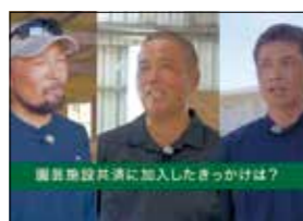
【動画】園芸施設共済制度(沖縄県内農家のインタビュー編)