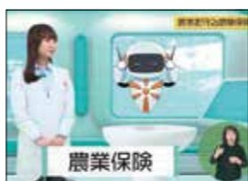
【動画】農家を守る農業保険(うまんちゅひろば R7.6)