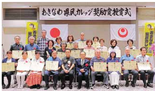
令和7年度奨励賞授賞式の様子

講座1時間を1単位として換算し、100単位ごとに申請により「奨励賞」を授与しています。「学びの証」として、奨励賞を目指して学びを深めていきましょう。