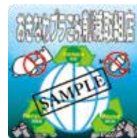
オリジナルステッカー