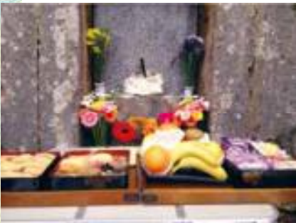
白餅や御三味(うさんみ)の重箱、果物、お花などのシーミーのお供物

二十四節気の「清明」にあたる4月5日を中心に行われる清明節や、旧正月や旧盆、あの世の正月と言われる「十六日祭」などは、今も沖縄の生活に根付く年中行事です。春分や秋分のお彼岸や、冬至やムーチーなどの季節に合わせて行う行事もあります。祖先を大切にし、旧暦が今も暮らしに根づく沖縄には、「冠婚葬祭の「祭」として数えることができる行事がたくさんあります。