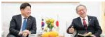
オ・ヨンファン済州特別自治道知事への表敬訪問

玉城知事は、県と友好協力都市協定を結ぶ韓国済州特別自治道を訪問しました。面談ではオ・ヨンファン知事に対し、済州フォーラムへの若者参加など、文化や歴史などを通じた未来を担う若い世代の交流促進を呼びかけ、オ知事からは、過去の苦難を乗り越え、未来へ歩む重要性和共