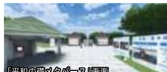
「平和の礎メタバース」画面