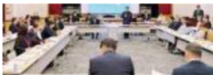
健康長寿おきなわ復活県民会議の様子

会議では、県民会議版「ロードマップ」の取組状況報告のほか、65歳未満の死亡原因について、高血圧関連疾患が最多で、中でも男性の脳内出