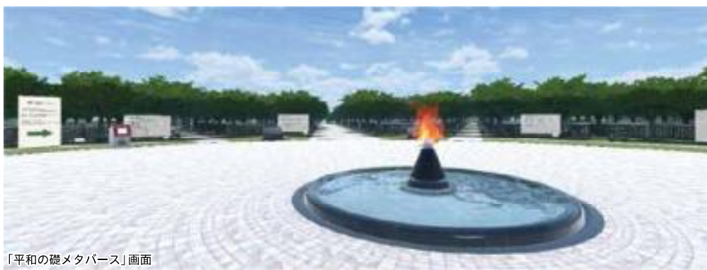
「平和の礎メタバース」画面