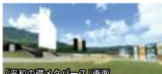
「平和の礎メタバース」画面