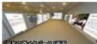
「平和の礎メタバース」画面