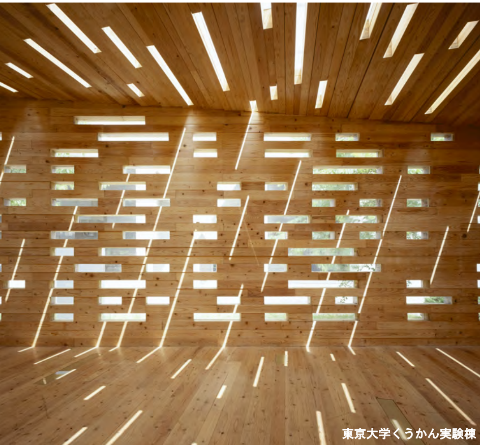
東京大学くうかん実験棟