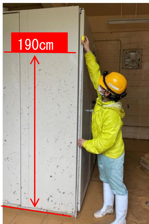
※平南取水ポンプ場浸水状況