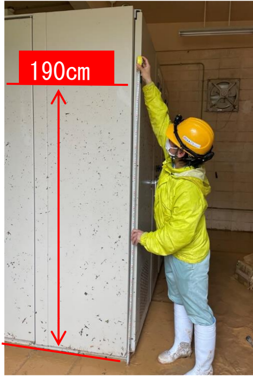
※平南取水ポンプ場浸水状況