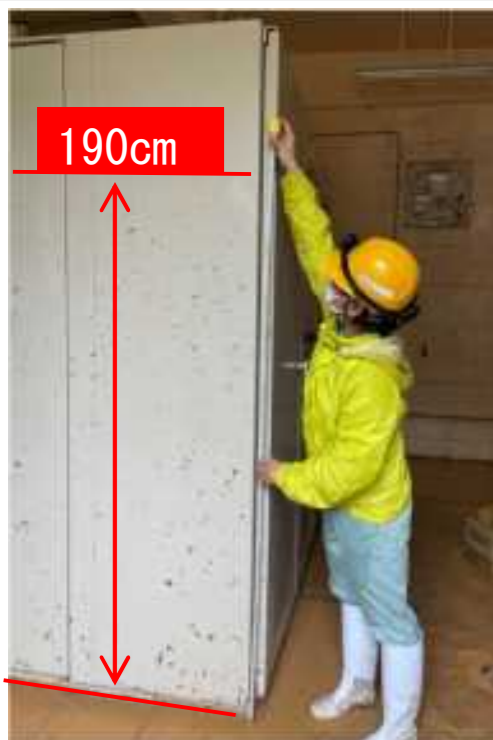
※平南取水ポンプ場浸水状況