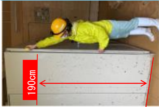
※平南取水ポンプ場浸水状況