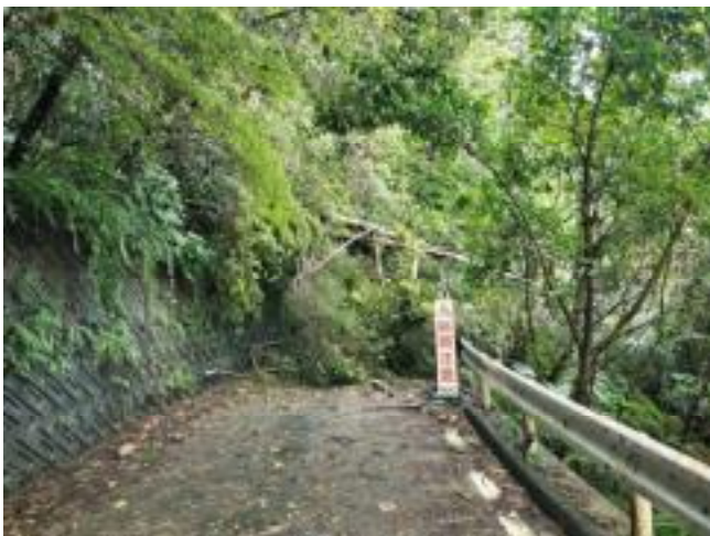
源河有銘線（法面崩壊・倒木）