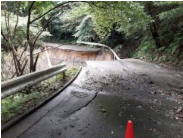
国頭村大国線（路肩崩壊・路面決壊）