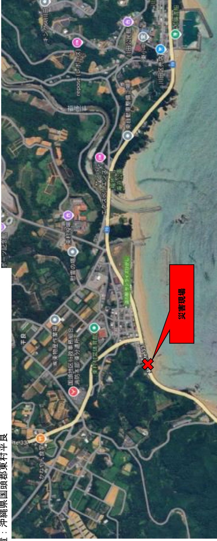
東村国道331号線での河川の間地ブロック崩壊により送水管路が被害 位置：沖縄県国頭郡東村平良

漏水が発生し浄水の供給が著しく阻害されるため、応急的に仮設管で切り回し工事を行う。 令和6年11月14日工事着手済み