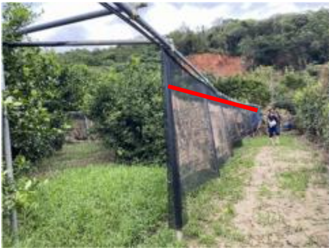
カンキツほ場における浸水被害