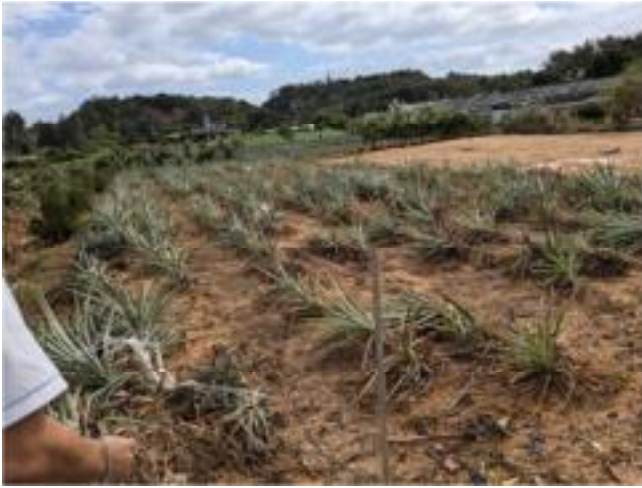
パインほ場における倒伏被害