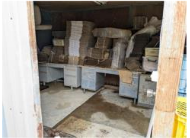
作業小屋の浸水被害