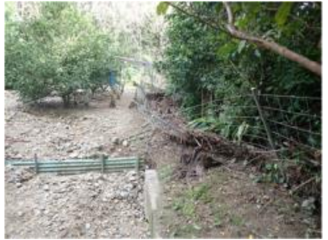
カンキツほ場への土砂流入