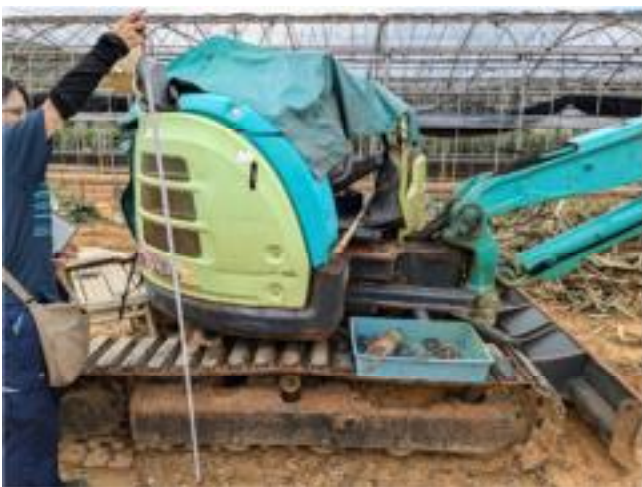
小型バックホーの浸水被害