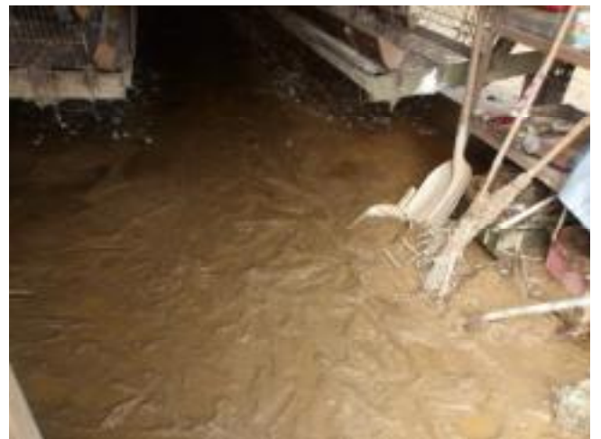
養鶏場における浸水被害