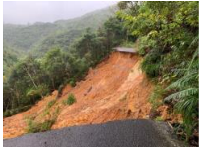
佐手与那（路肩崩壊・路面決壊）