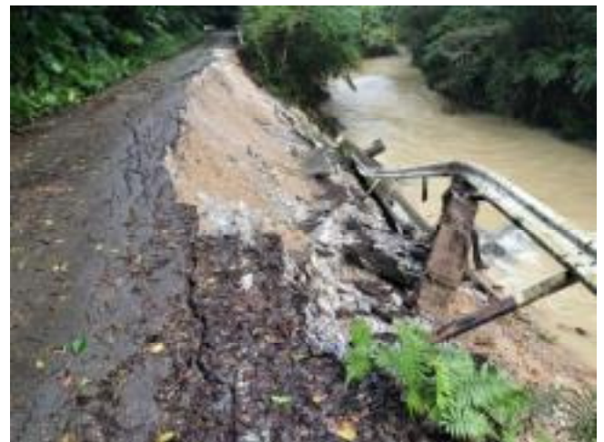
名護市源河有銘線（路肩崩壊）