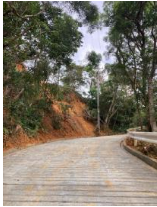
東村 平良 3号農道（被災後） ⇒ 東村 平良 3号農道（応急復旧後）