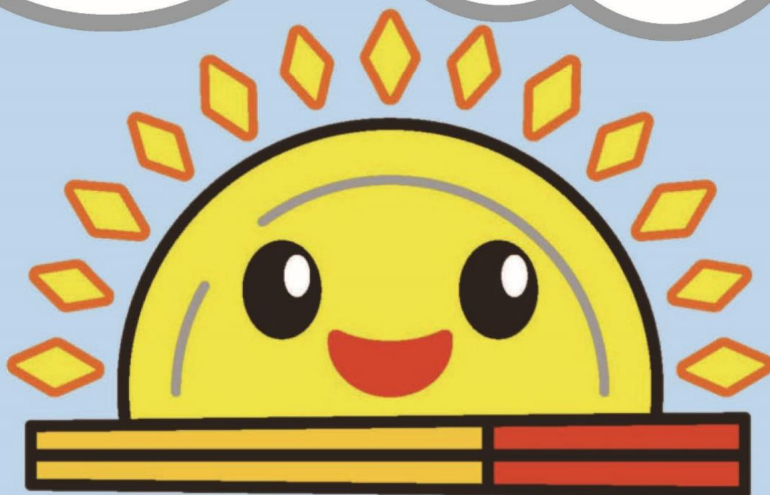
沖縄県食品ロス削減県民運動ロゴマーク