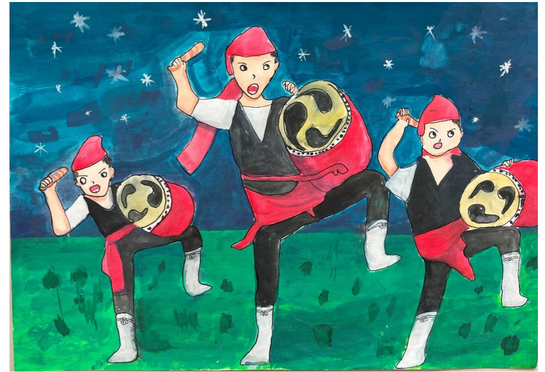
『夜のエイサー』 沖縄カトリック小学校5年 増井 響心