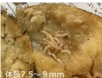
体長 7.5～9 mm