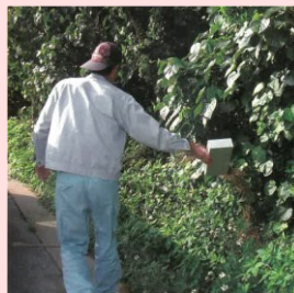
人力での放飼(左)と放飼された成虫(右)