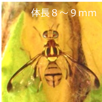
体長 8～9 mm

沖縄本島北部地域において令和6年3月、海外から侵入した農作物の害虫 セグロウリミバエ がトラップ調査により発見されました。 本種がまん延すると農作物に大きな被害を及ぼす恐れがあるため、防除を実施しております。皆様の 防除へのご協力をお願いいたします。