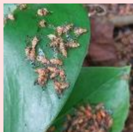
人力での放飼(左)と放飼された成虫(右)