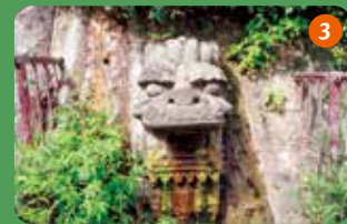
龍頭を発見！ヒージャーガー（樋川井）への水脈が断たれて、水が湧き出たので龍頭が付けられたそう。