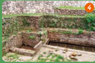
石積みで囲まれた野嵩クシヌカー（湧泉）は、ウブミジ（産水）やワカミジ（若水）をくんだり、生活を支えてきた場所。

各集落に大切に 残る 貴重な史跡を 探訪 本島中部、西海岸沿いに位置する宜野湾市は、沖縄とアメリカの雰囲気が感じられる場所。西側には美しい東シナ海が広がり、市を横断する国道58号沿いにはアンティーク家具店をはじめ、おしゃれなショップやカフェが点在。週末には多くの人が訪れます。 市内には、古き琉球を知ることができる名所や旧跡が数多く残され、王府とのつながりを感じさせます。また、湧き水に恵まれた地域なので、人々の暮らしを支えてきたカー（湧泉）の跡も多く見られます。