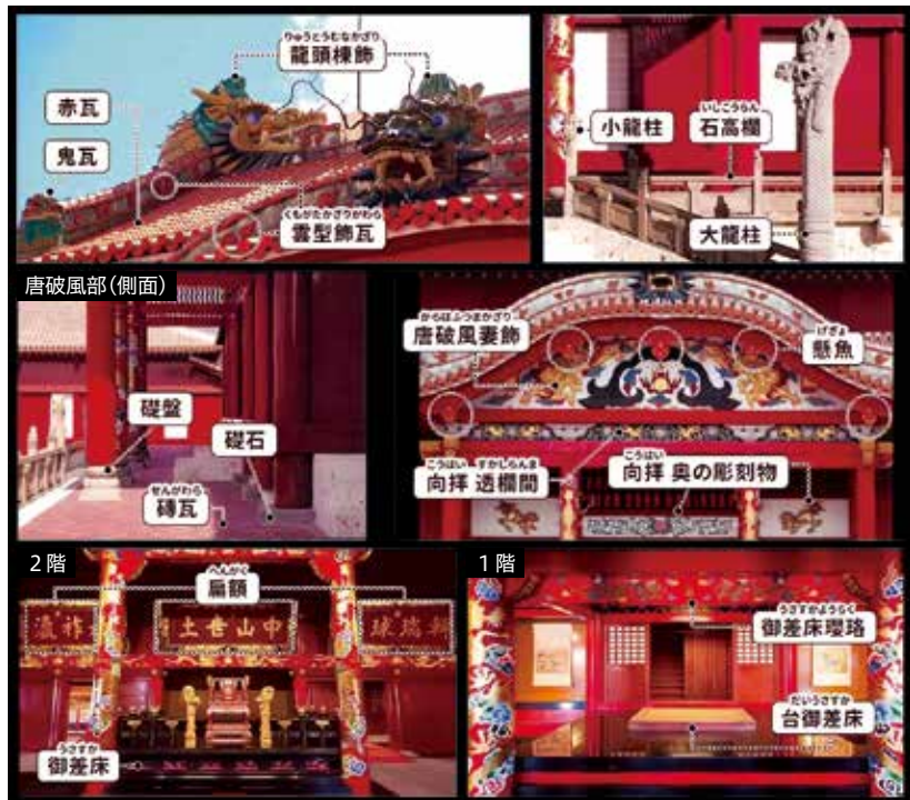
寄附金を活用し製作する部位