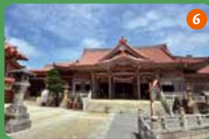
首里王府から特別の扱いを受けた琉球八社の一つである普天満宮。中北部最大の聖地といわれ参詣者も多いという。