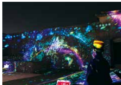
令和5年度に実施した首里城復興イベント(プロジェクションマッピング)の様子