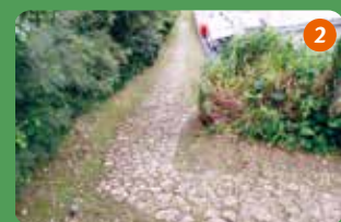
野嵩スティバナビラ（袖離れ坂）石畳道は、近世琉球に首里王府の公道として整備された宿道（すくみち）の一部。