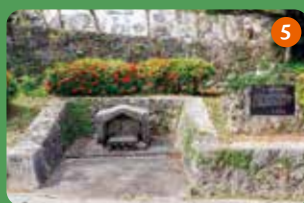
1830年頃、大干ばつが続き、水不足に苦しんだ村の人たちが掘り当てたミーガー（新泉）。現在は拜所となっている。