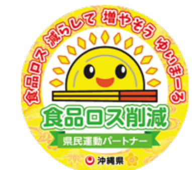
食品ロス削減県民運動パートナーステッカー