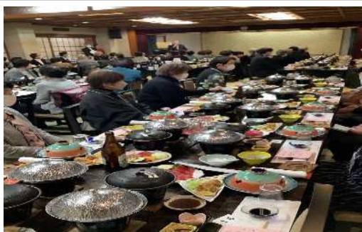
永年勤続職員への感謝の集い

仕事による緊張感と責任感のおかげで元気に健康でいられている気がします。人生の先輩である利用者さまから「ありがとう」と感謝の言葉を頂けると恐縮するとともに大変嬉しく思います。まだまだ長く働けるよう頑張ります。