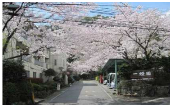
春には満開の桜を観ることができます

人手不足が叫ばれる介護業界ですが、経験や技術のあるシニア職員は、人生経験が豊富で周囲への気配りもできるので安心して仕事を任せられます。また、利用者の方や若手職員にも家庭的な優しさで対応してくれるため、法人にとって欠かせない存在です。定年後に家にこもってしまうのではなく勤務することで健康維持の手助けになると考え、「生涯現役」で働けるような職場作りを進めています。健康が続く限り末永く勤めていただきたいです。