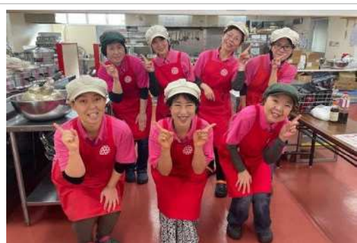
みんなが働きやすい職場環境づくりを目指しています

生涯現役で働くとか若い頃は考えたことも無かったのに、死ぬまで一緒に若い子達のお役に立って行こう、年をとったらごはん毎日食べさせてあげる、痛いところがあったら隠さずに声に出しなさい、みんなが助けてくれる、寂しい思いは絶対させない、はっちゃんのこの言葉が原動力となって毎日走り回れることがありがたいです。感謝しています。