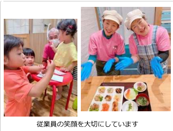
従業員の笑顔を大切にしています

現在20人近い高齢者が従事しています。若い時に入社し、そのまま長年勤務している人も多いです。各自の体力や事情に適した働き方で活躍しています。高齢者の採用も活発で、65歳以上の採用機会も多く、ほとんどの方が長く従事しています。また障がいのある高齢者も多く活躍されています。それぞれの体力と家庭事情に適したシフトで働ける環境が整っています。