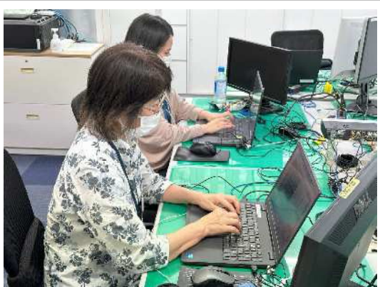
ベテラン社員と若手社員ペアの連携入力