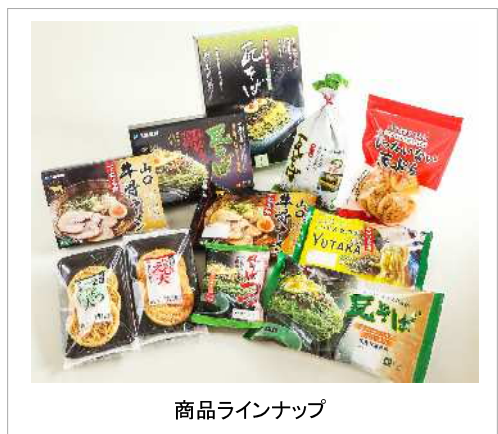
商品ラインナップ