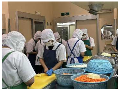
学校給食センターの様子

2023年、熊本県ブライツ企業・SDGs企業に登録されました。多様な人材が十分に活躍できる環境の整備に取り組み、人手不足が進んでいく中、高齢者、障がい者の雇用を積極的に行っています。高齢者においては、長年の経験と知識を活かしてそれぞれの職場で生き生きと活躍していくことを目指しています。