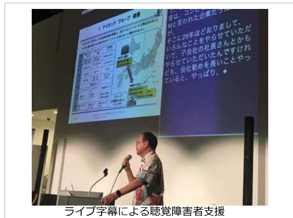
ライブ字幕による聴覚障害者支援

社会に貢献し、地域の発展に寄与する企業として、平成20年に設立しました。 想いのある方であれば、年齢に関係なく働けるように、平成26年から定年制を廃止しています。 地域の雇用推進を図り、ベテランから若手まで、すべての社員が働く喜びを共有し、聴覚障害をお持ちの方々の生活を支える技術開発とサービス提供を実現させ、世界に羽ばたく企業を目指します。