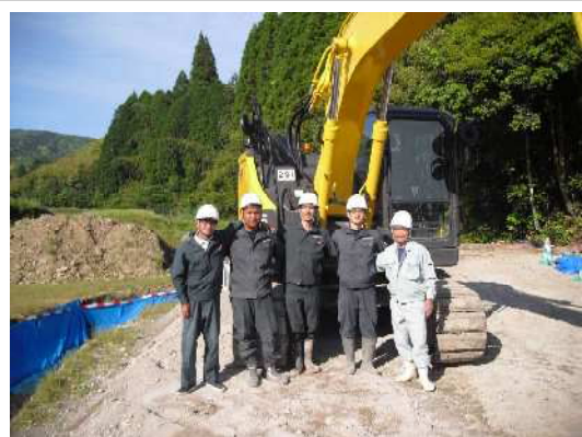
現場ではベテラン社員も活躍しています！

また、各現場においては各年齢層を万遍なく配置するよう努め、豊富な経験や資格を有するベテラン社員が若手社員のサポートを担うことで、技能・経験の継承や社員同士のコミュニケーションの活発化が図られ、ベテラン社員の働きがいの維持にも繋がっています。