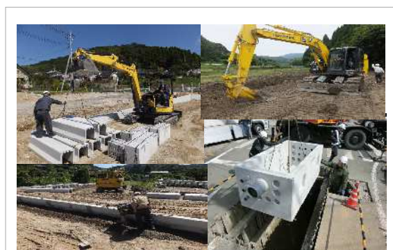
現場（電線類地中化事業他）の様子

体を動かすこと、働けることが私の生きがいとなっております。また、土曜日、日曜日が休みであることで、農作業も十分できています。リフレッシュできることで、また1週間がんばろうというやる気が湧いてきます。家族からは怪我などの心配があるようですが、それなりに十分注意して、会社から必要とされる限りは頑張りたいと思います。