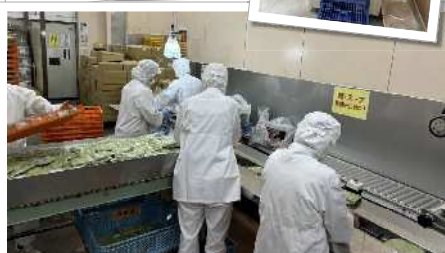
高齢者が働きやすい作業場