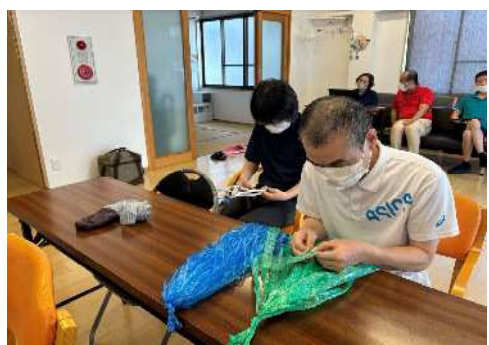
介護事業所の様子

・学校給食センターの配送をしています。給食を待っている子ども達の顔を思い浮かべながら、安全運転に心がけて毎日運んでいます。