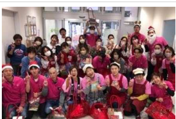
年齢問わず社内イベントを楽しむ風景