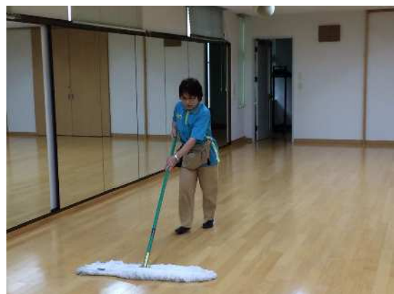
腰や首に負担のかからない長さのモップ