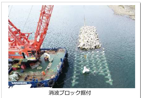
消波ブロック据付

60歳以降も、まだまだ現役で働きたい気持ちがあり、現在も希望している業務へ携わっています。若手社員のパワフルな刺激をもらいながら、自分も負けるものかと日々奮闘しております。健康面や体力面も考慮し、週3日で勤務していますが「社会とのつながり」があることで、とても充実した毎日を送っています。（70代社員）