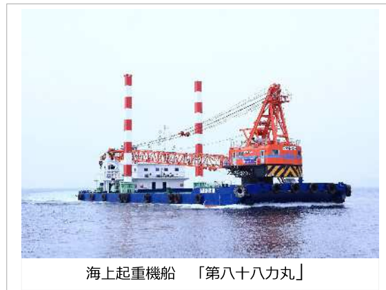
海上起重機船 「第八十八力丸」

約10年以上前から定年制度を完全撤廃し、現在は60代が4名、70代が2名在籍しています。定年制度を撤廃することにより、熟練社員の技術やノウハウを確実に継承することができ、若手育成にも寄与すると考えました。現在も20代から70代の幅広い世代が切磋琢磨し、日々の業務に取り組んでおります。また、年齢や性別などに関係なく、誰もが平等に働きやすい職場を目指しており、長崎県の「誰もが働きやすい職場づくり実践企業」の認証も受けています。