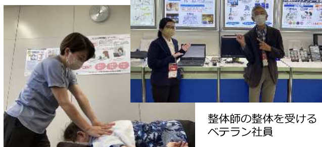
整体師の整体を受ける ベテラン社員