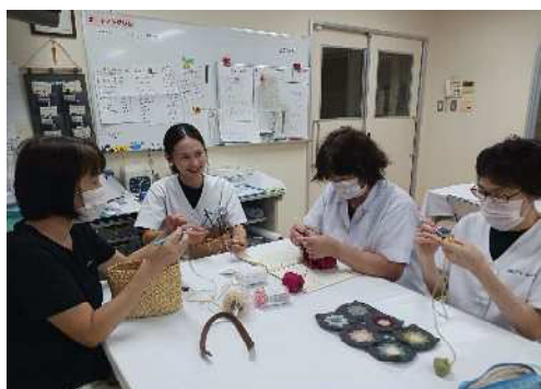
「編み物クラブ」で若手職員と交流