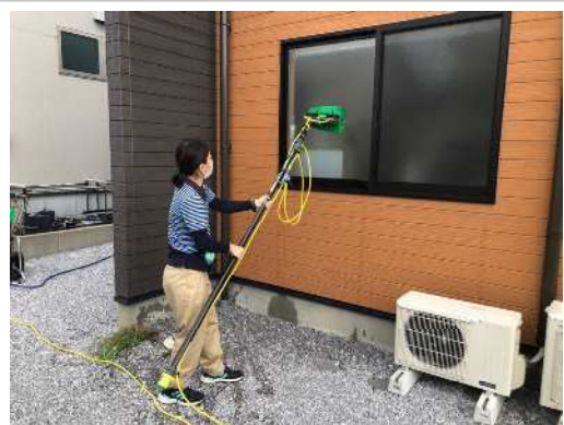
高齢者でも軽く持ち上げることができ、 高い窓の掃除がより安全にできる用具