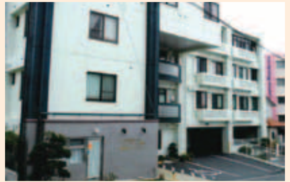
エバーグリーン経塚、経塚デイサービスセンター