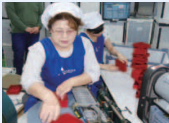
幅広い世代が共に活躍しています

就業形態の自由度は高いです。社員、パート（フルタイム）、パート（短時間）という3つの就業形態に加え、内職スタッフ（請負）の形も導入しながら高齢者の方々に最大限自分に合ったものをお選びいただいています。また、工場や事務所内の安全衛生の充実のために、会社全体で5S活動や安全衛生活動等を積極的に行い、高齢者の方々のみならず全ての方々が働きやすい環境づくりに努めています（5S活動は期末に表彰もあります）。