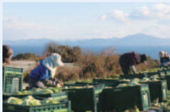
レタスの収穫風景

農業生産法人を設立し、地域の人手の足りない農家に経験豊富な高齢社員を派遣し収穫の支援等をしています。