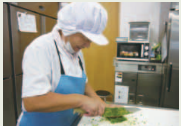
やりがいを持って働く高齢者

また、高齢者が無理なく就労できるよう、ゆとりある作業スペースを確保したり、バリアフリー化を進めるなど、高齢者に優しい職場づくりに努めています。