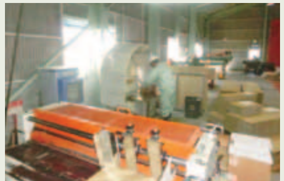
作業しやすい環境で仕事をする様子

その他、毎朝のラジオ体操・転倒防止対応の片足立ち（片足30秒毎）を実施し、高齢者の健康面に配慮した取組を実施している。