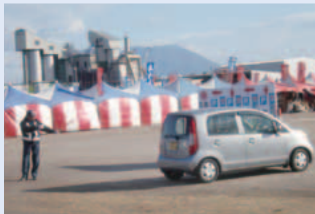
交通誘導をする様子

また、健康管理面においては、年1回人間ドックを受診してもらい、できるだけ従業員が健康で長く働き続けられるように健康状態等を把握し、雇用形態・勤務内容等を決定しています。