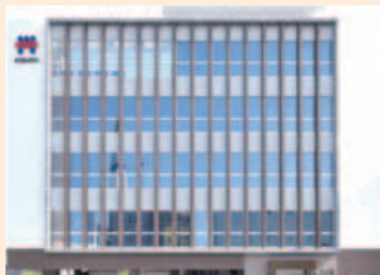
創立40周年を機に移転した本社ビル