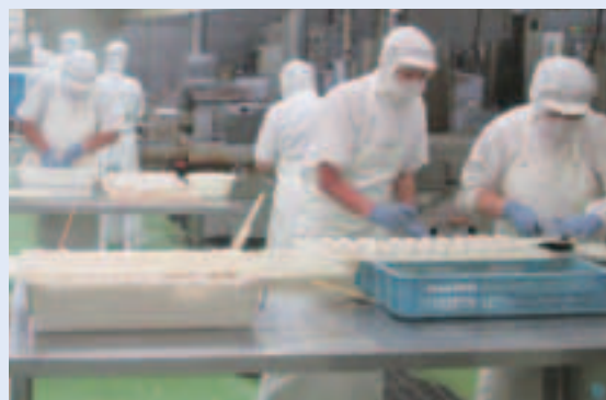
さつま揚げを製造している様子