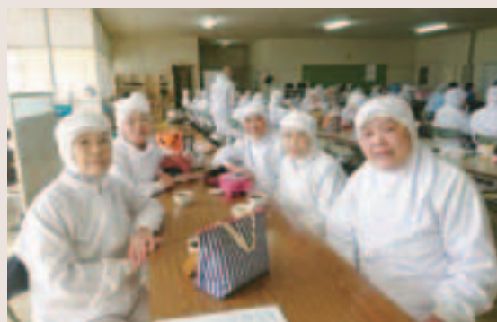
ブロイラー事業部の皆さん

年齢制限は設けておらず、希望等があれば慣れた職場で今までの経験を活かして働き続けることができる環境を整え、71歳の職員が現役で働いています。さらに、食鳥検査等の国家資格を有する職員については、71歳の方であっても、常勤職員と同様に勤務していただいています。