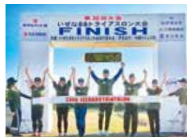
トライアスロン大会