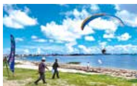
令和5年度モーターパラグライダー大会&体験会

誰でも参加できるモーターパラグライダー体験会やシャフルボードなど、体験型の種目も開催しますので、ご家族やご友人をお誘い合わせの上、お近くの会場へぜひご来場ください。