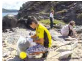
ビーチクリーン活動