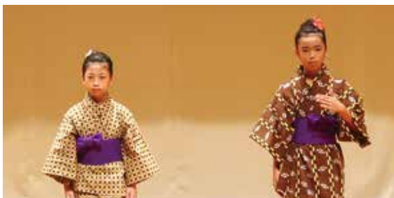
令和5年度しまくとぅば語やびら大会

その中でも、今年で第29回目を迎える「しまくとぅば語やびら大会」では、各市町村文化協会および市町村の推薦を受けた話者が、それぞれの地域自慢の「しまくとぅば」を披露してくれます。