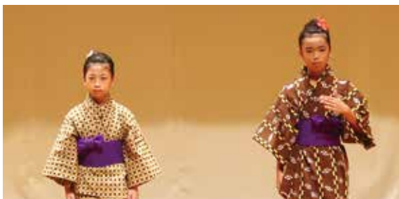
令和5年度しまくとぅば語やびら大会

その中でも、今年で第29回目を迎える「しまくとぅば語やびら大会」では、各市町村文化協会および市町村の推薦を受けた話者が、それぞれの地域自慢の「しまくとぅば」を披露してくれます。