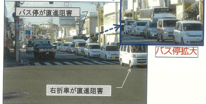
②国道329号(コザ高校側)