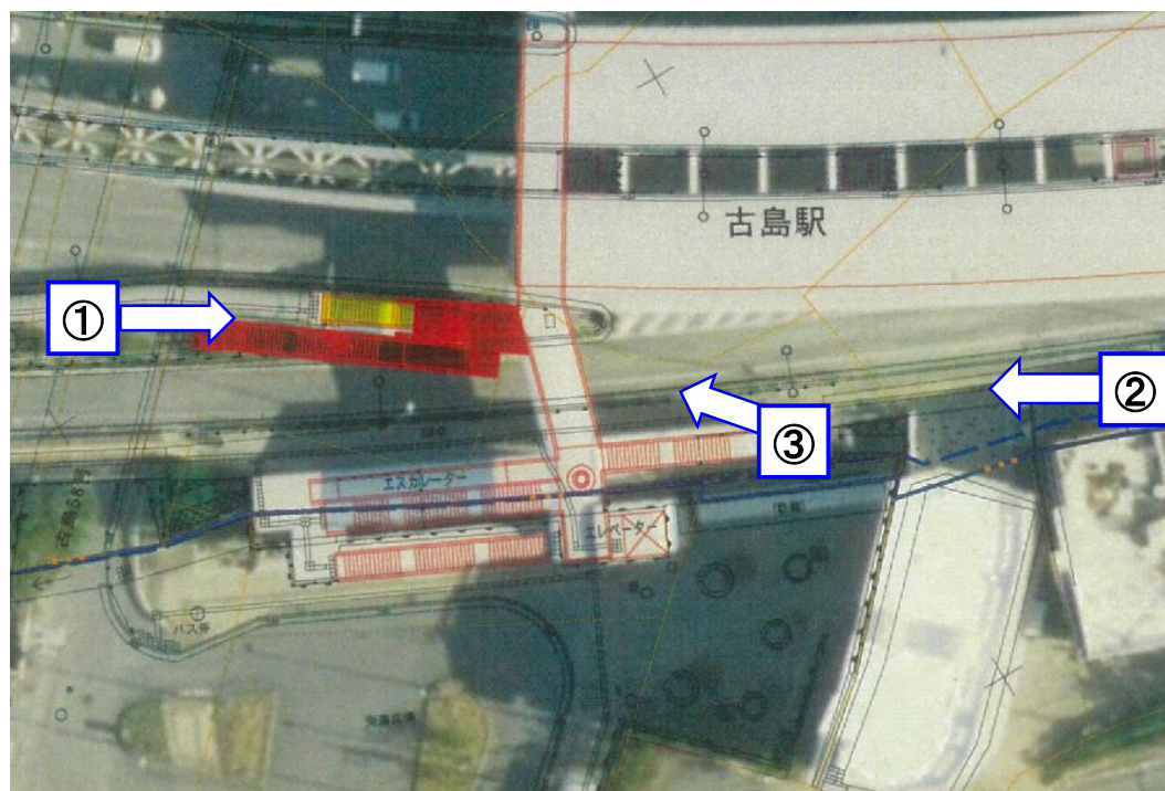
①バス停との連絡は階段となっている