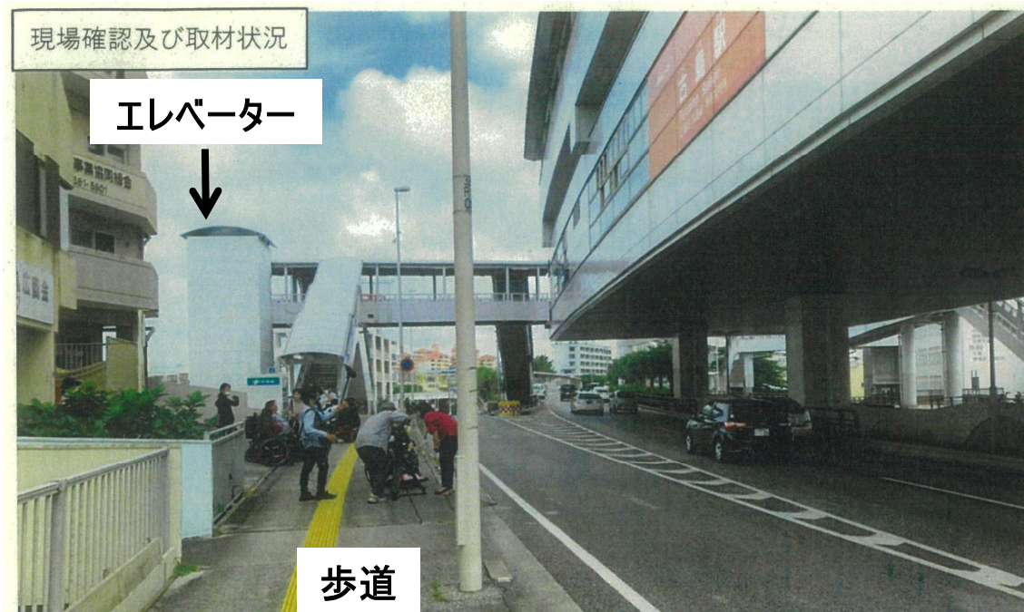
③歩道とバス停の間に車道、横断歩道無し