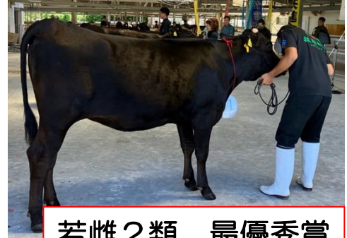
若雌2類 最優秀賞 下地牧場 しもじ9