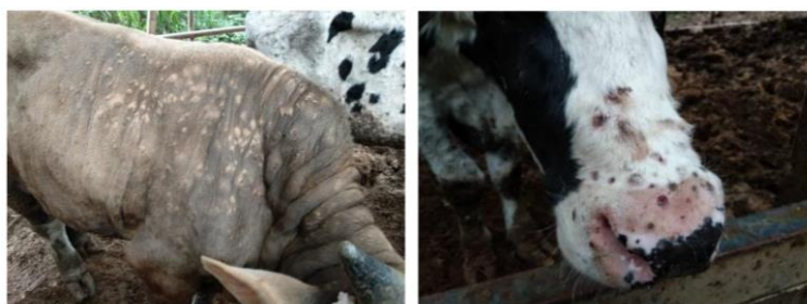
全身に結節が見られる