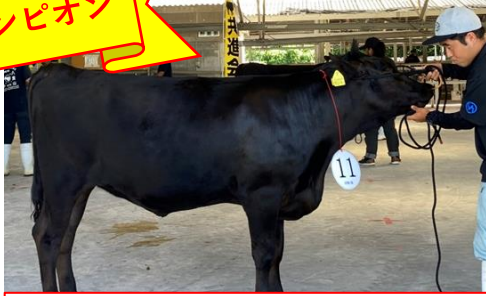
若雌1類 最優秀賞 玉代勢牧場 はなかめ