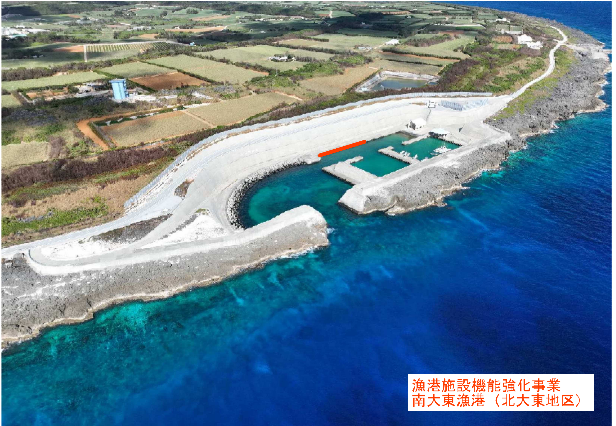
漁港施設機能強化事業 南大東漁港（北大東地区）