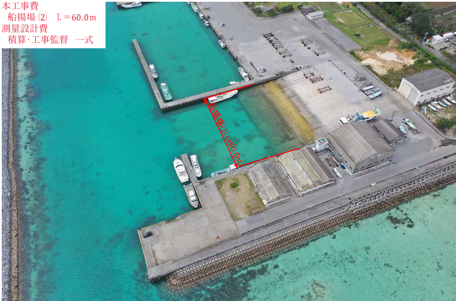
具志漁港 第1種 伊江村管理 昭和45年指定 令和5年撮影