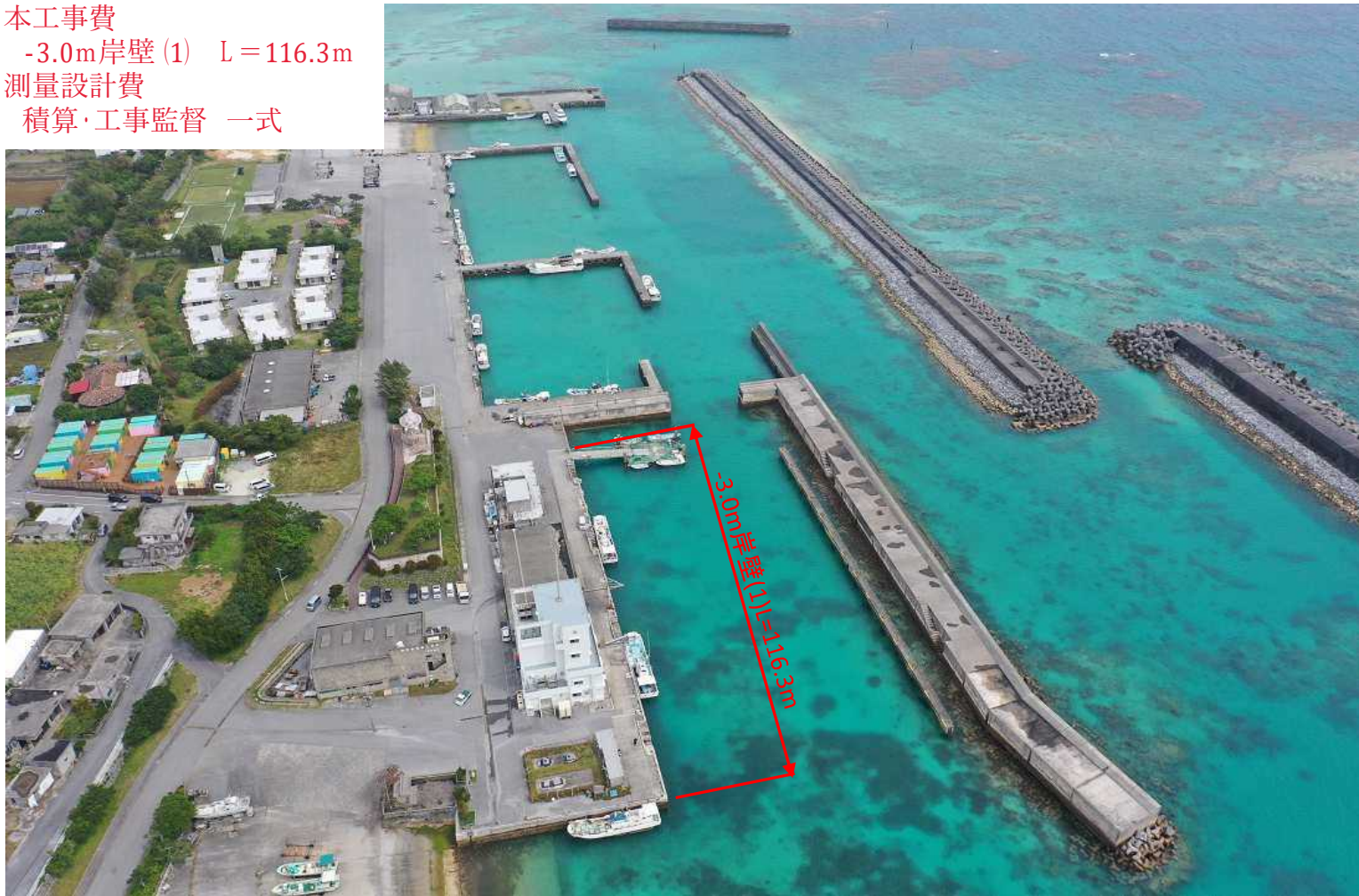
具志漁港 第1種 伊江村管理 昭和45年指定 令和5年撮影

本工事費 -3.0m岸壁(1) L=116.3m 測量設計費 積算・工事監督 一式