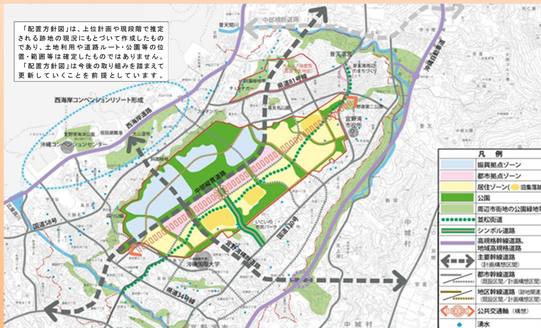
図 I - 2 普天間飛行場跡地利用の位置づけ・目標

ネットワーク型の公園緑地を中心とした配置方針図を作成 —世界に誇れる環境づくり—