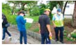
通学路の安全点検