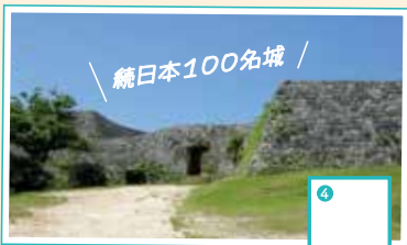
琉球三線音楽の始祖を祀ったお宮