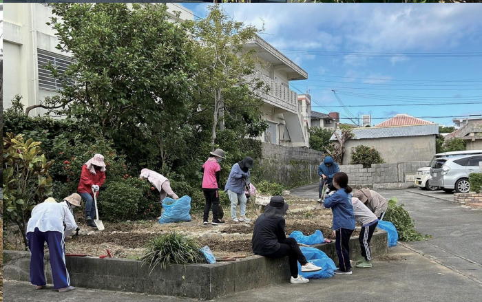
(左上) 6月ウマチーの綱引き (右上) 旗頭 (左下) 綱作りの様子 (右下) 婦人会による美化活動