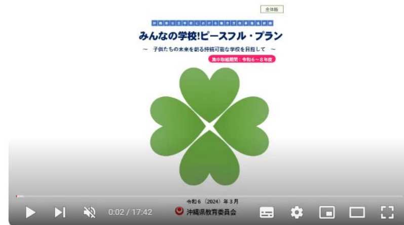
沖縄県公立学校働き方改革推進計画「みんなの学校!ピースフル・プラン」(全体版) ☞ 限定公開

https://www.pref.okinawa.jp/kyoiku/edu/1008490/1008491/1008508/1024388/1027590.html