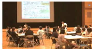
写真:研修会の様子

修了式、始業式の時期を変更して春休み期間を十分に確保していることも本研修会の開催や任意参加方式の研修会の実施につながっている。