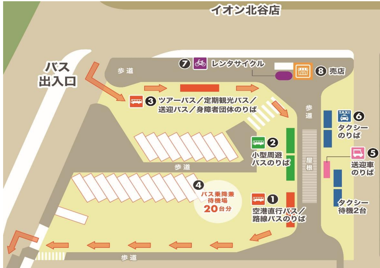
(北谷ゲートウェイ レイアウト)