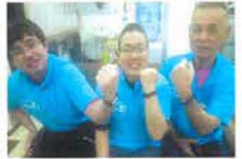
活動量計により身体活動データを見える化

「働き方改革」「高齢社会」「人手不足」…明日のために、「健康経営」は避けられない！