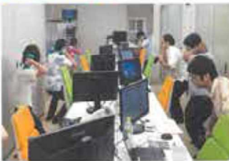
姿勢トレーニングによる筋トレを实践