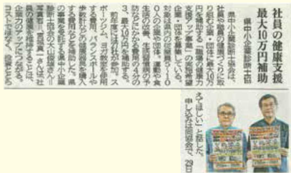
平成30年6月10日(日) 沖縄タイムス 経済面