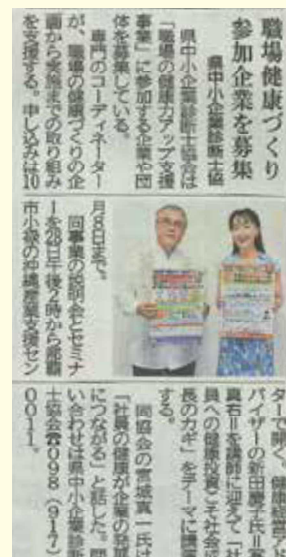
平成30年9月9日(日) 琉球新報 経済面