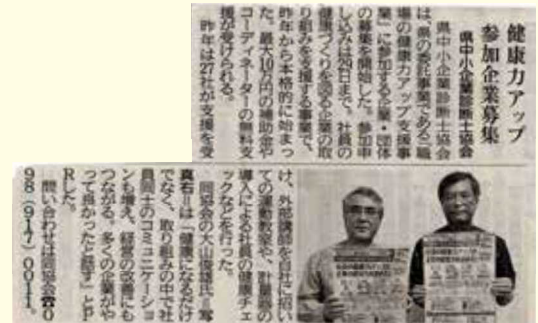
平成30年6月14日(木) 琉球新報 経済面