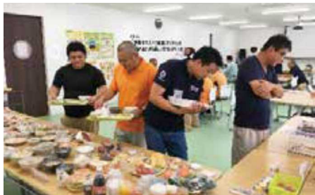
食育SATシステムの活用