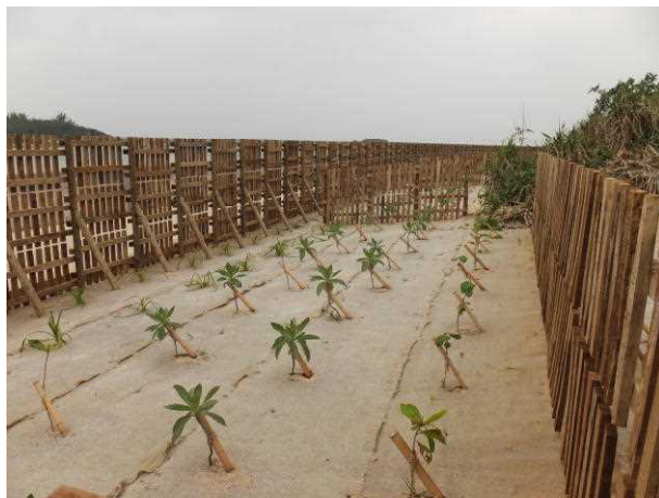
治山事業による木製防風工利用（久米島町大原）

このような背景から、公共事業における木材利用の積極的な推進や管内の木育活動などをおして県産材の利用拡大に向けた取り組みを行っている。