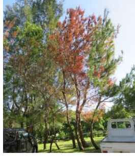
松くい虫被害状況（読谷村）