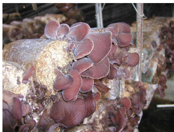
キクラゲの発生状況