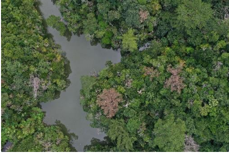
松くい虫被害状況（うるま市）