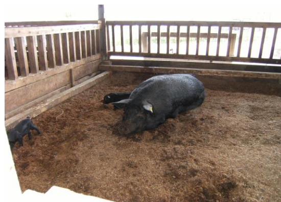
オガ粉を敷材に利用した豚舎