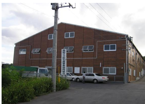
オガ粉生産施設（八重瀬町）