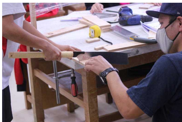
沖縄アミックス中学校木育出前講座（令和2年11月）

※木育とは、市民や児童の木材に対する親しみや木の文化への理解を深めるため、多様な関係者が連携・協力しながら、材料としての木の良さやその利用の意義を学ぶ、木材利用に関する教育活動を推進すること。（森林・林業基本計画）