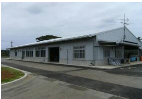
ゲットウ加工施設（北大東村）