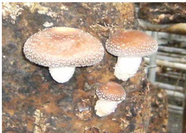
シイタケ（菌床）の発生状況