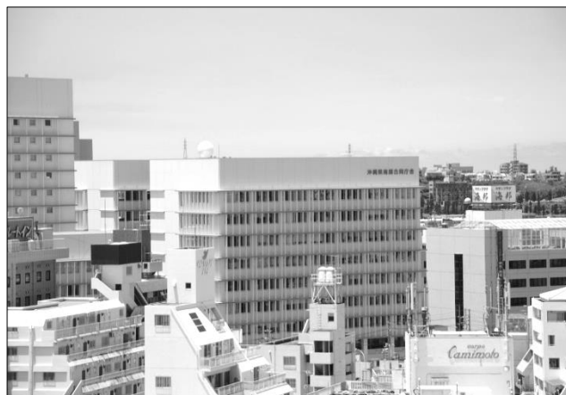
沖縄県南部林業事務所（沖縄県南部合同庁舎5階）