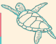
きれいな海をいつまでも