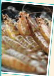
車海老の生産量日本一!