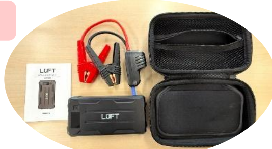
ポータブルジャンプ スターター