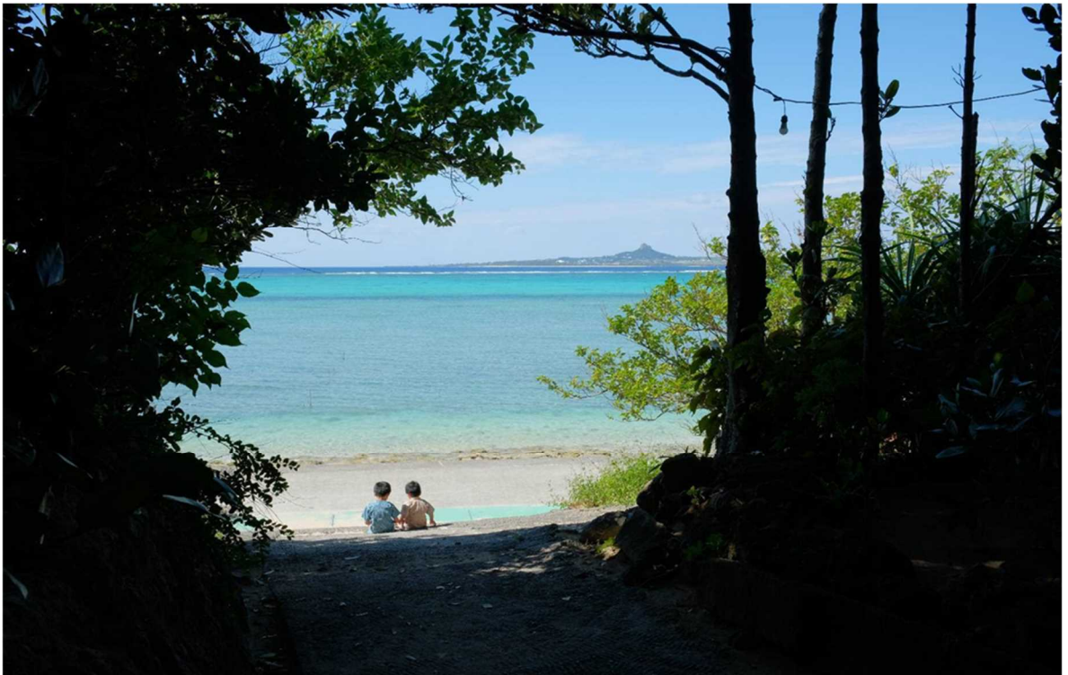
「フクギと海とタッチュー」 撮影場所：備瀬のフクギ並木