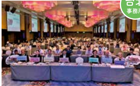
澎湖県文化局主催海洋フォーラム

▶台湾本島から約50キロの距離にある澎湖県で開催された海洋フォーラムでは、「沖縄の海洋文化と台湾との漁業の繋がり」をテーマに、琉球王国と大交易時代の概要や、漁業でのつながりなどを紹介しました。