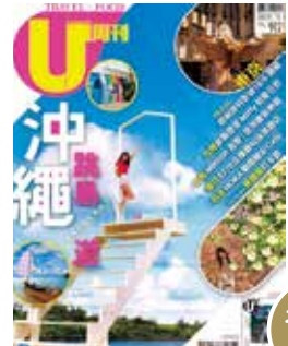
香港旅行雑誌の離島紹介