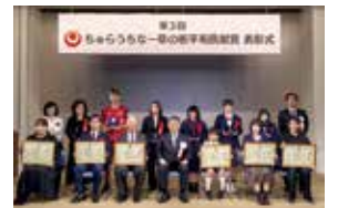
第3回ちゅうちな一草の根平和貢献賞表彰式

表彰式では、照屋副知事が一般部門1個人2団体、学校関係部門3団体を表彰し、平和教育に力を入れている学校や身近な社会貢献活動に取り組む関係者に感謝の意を伝え激励しました。また、シンポジウムでは、歴代の沖縄平和賞受賞者による講演やトークセッションが行われ、私たちが平和に貢献できることについて話し合いました。