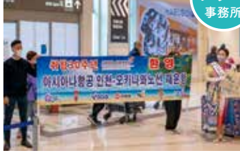
アシアナ航空 那覇-ソウル 再開

▲仁川-那覇間に5社が就航しているほか、2023年5月と10月には、 チェジュ 済州と那覇を結ぶチャーター便が運航されました。