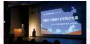
令和5年度沖縄平和賞シンポジウム