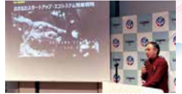
戦略の発表にあたりあいさつする玉城知事

産学官金の56団体が加盟する「おきなわスタートアップ・エコシステム・コンソーシアム」の年次集会在開催され、玉城知事が出席しました。