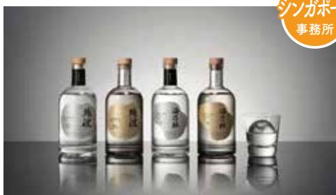
海外専用ボトル・ラベル

▶ 琉球泡盛と焼酎の認知度の向上に向けて、九州各県の酒造組合や各県の香港事務所、香港の流通事業者、日本政府機関などが連携し、有名バーテンダーに琉球泡盛カクテルを作ってもらい、お客様に投票してもらう「カクテルコンペティション」や、香港内の飲食店約40店舗におけるPRイベントなど取り組んでいます。