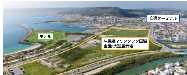
沖縄県マリンタウン国際会議・大型展示場およびマリンタウンMICEエリアの計画地全景

県では、与那原町と西原町にまたがる中城港湾マリンタウン地区に、民間のノウハウや創意工夫が十分に発揮される官民連携の手法によって、沖縄県マリンタウン国際会議・大型展示場(大型MICE施設)の整備・運営を目指して取組を進めており、令和11年に施設の供用開始を予定しています。あわせて、ホテルなど民間収益施設の整備を行うことにより、地域のにぎわい創出につながっていきます。