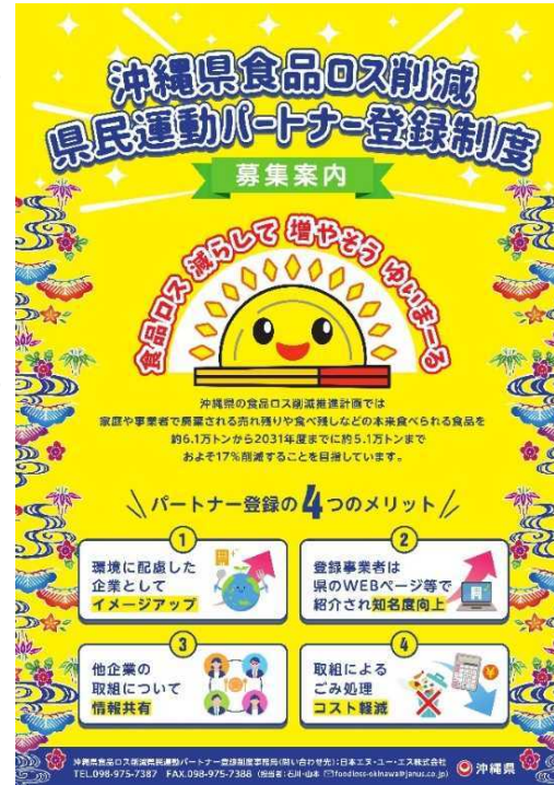
沖縄県食品ロス削減県民運動パートナー登録制度周知チラシ