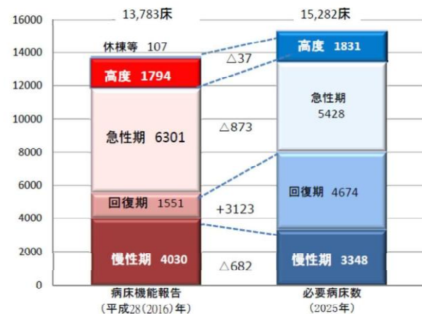
図2 平成 28(2016)年の病床機能報告（許可病床数）と 2025 年における必要病床数との比較

特に、不足が顕著である回復期機能については、病床機能の転換による確保を支援し、将来見込まれる医療需要に適切に対応できるようバランスのとれた医療提供体制の構築を促進します。