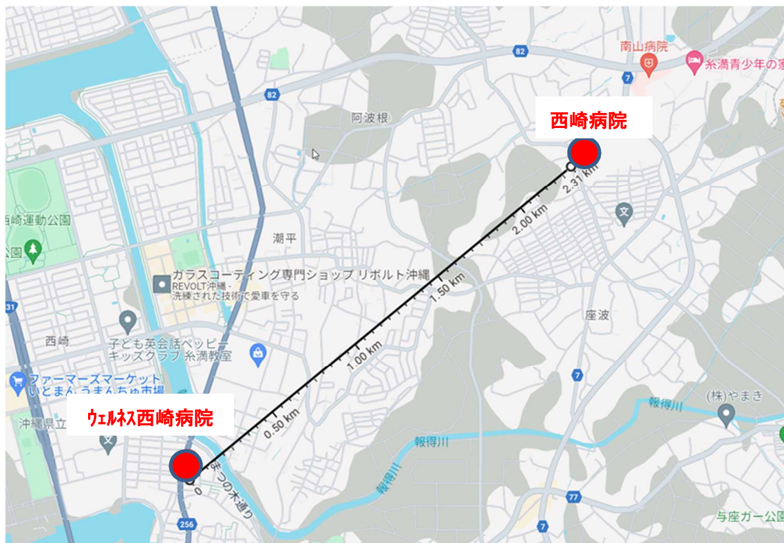
西崎病院とウェルネス西崎病院は直線距離で約2.3km 車で7～8分の距離にあります