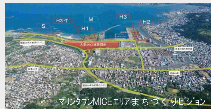
マリンタウンMICEエリアまちづくりビジョン