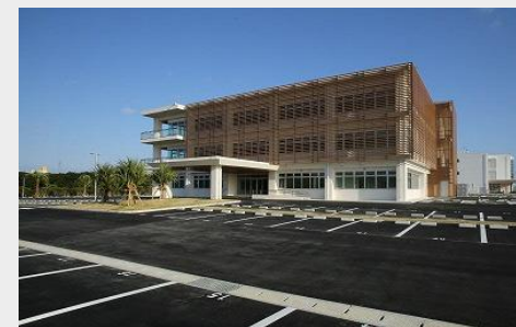
沖縄IT津梁パークアジアITビジネスセンター