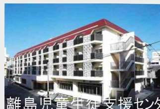
離島児童生徒支援センター