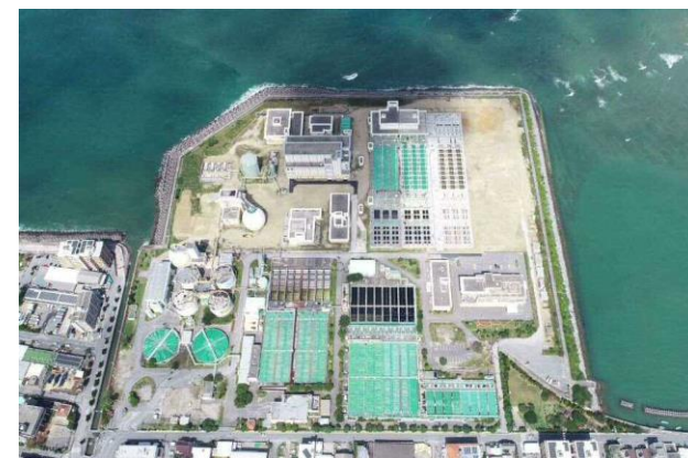
宜野湾浄化センター